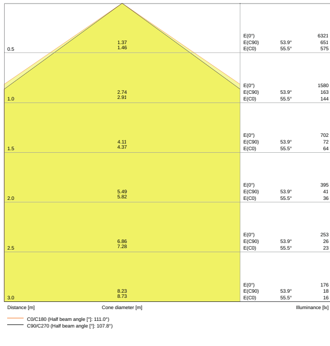
LDC typ cone