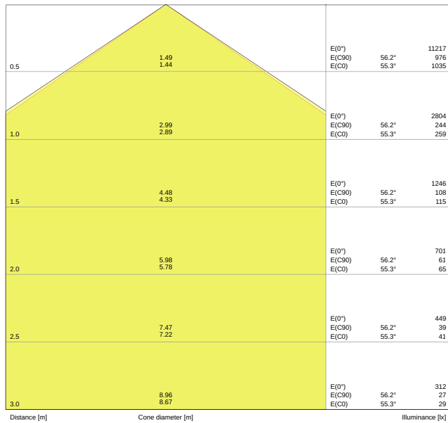
LDC typ cone